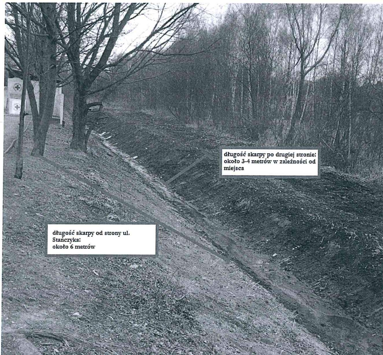
(zdjęcie pogładowe skarp Potoku Zagórskiego po oczyszczeniu w lutym 2018 roku – I odcinek)